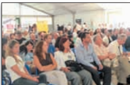
Un public nombreux a investi le chapiteau installé place Saint Nicolas