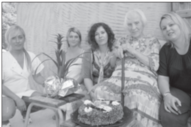
Gâteau, fleurs et tendresse pour les 100 ans de Zia Comtessa !