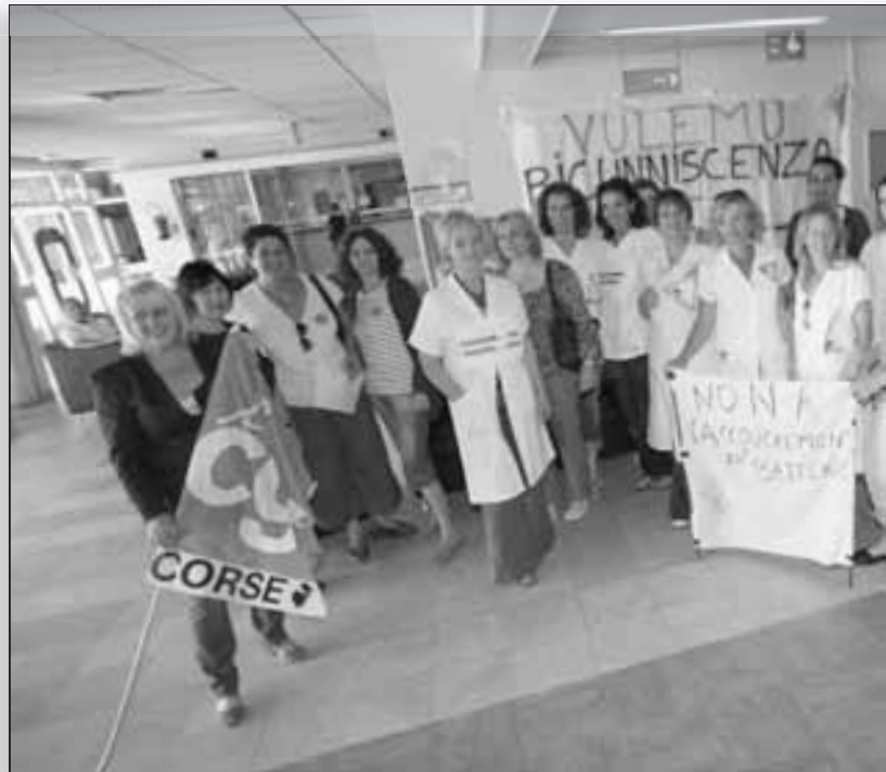
Les sages-femmes du CH de Bastia, dans le hall de l'Hôpital, le 12 mai dernier

Une sage-femme y démarre son activité à environ 1500 euros pour un travail dont on ne peut nier le caractère de pénibilité, avec des gardes d'en général 12 heures, une disponibilité et une responsabilité de tous les instants, de jour comme de nuit, en semaine et en week-end.