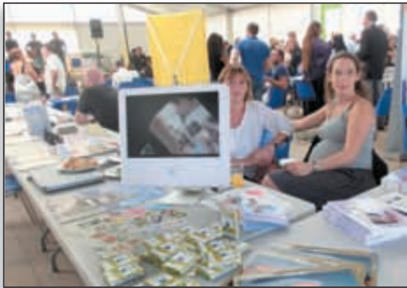
Parmi les participants exposants, l'Adecec, dont le jeu «E sette famiglia» a connu un franc succès