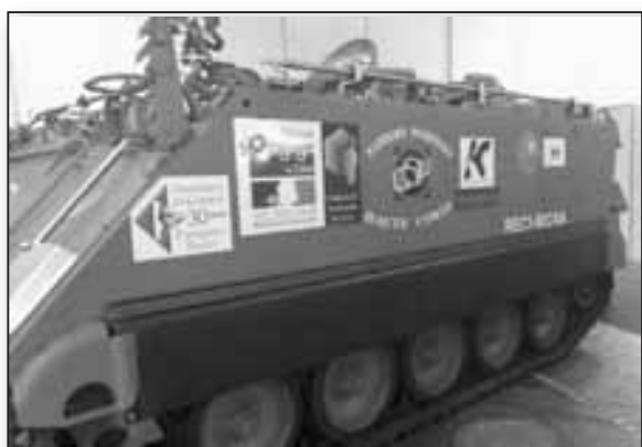
La «bête» imaginée par l'Université de Corse et testée cet été par le SDIS 2B