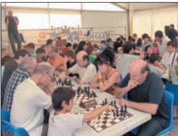
Les échecs font eux aussi la part belle à la langue corse