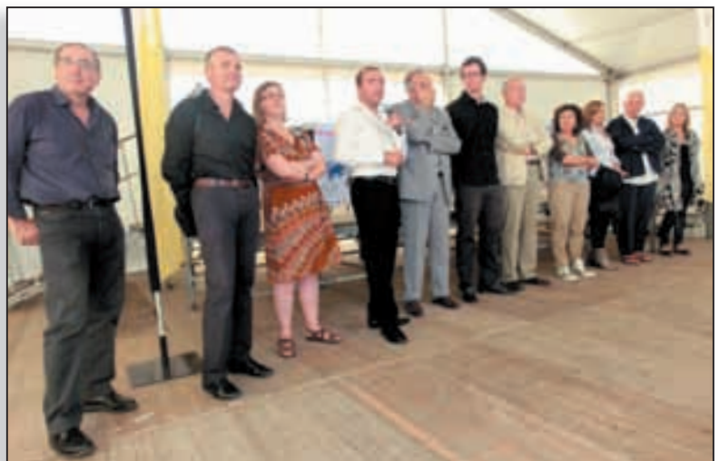
Les acteurs de l'ouverture de la première édition de Linguimondi