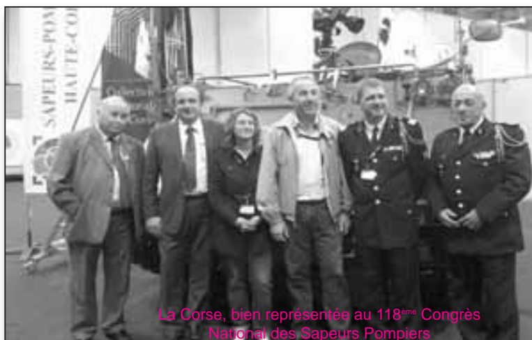
La Corse, bien représentée au 118 ème Congrès National des Sapeurs Pompiers

Il faut dire que dans sa manche et autour du thème choisi, «Risques et environnement», la Corse, représentée par la CTC, accompagnée là de l'Office de l'Environnement, de l'Agence du Tourisme et des deux SDIS de Corse du Sud et de Haute-Corse, avait une carte maîtresse à jouer : le projet